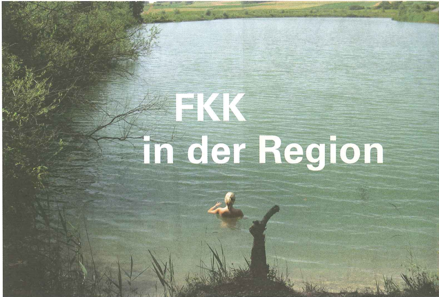
Lauschige Badenischen bei Bergheim nahe Neuburg a.d. Donau